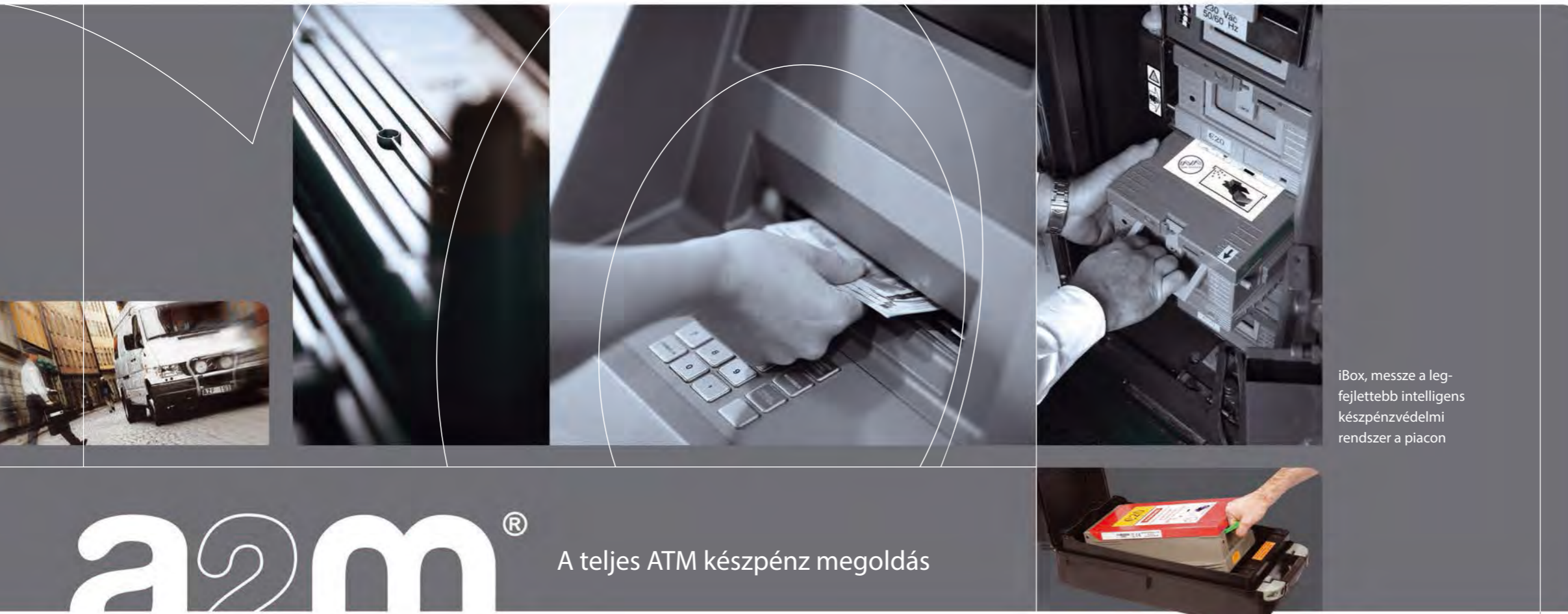
iBox, messze a legfejlettebb intelligens készpénzvédelmi rendszer a piacon